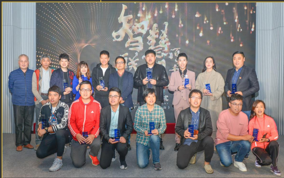
无锡广电集团领导班子 和工作室合影